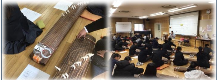
基礎的な弾き方の練習