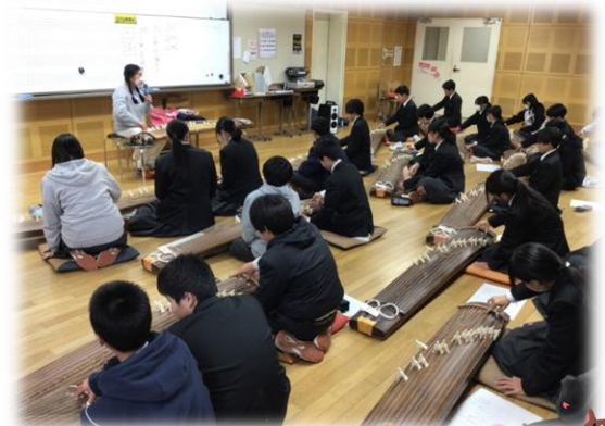
集中して「さくらさくら」の演奏に挑戦